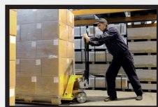
Bodegas y espacios industriales medianos