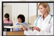
Hospitales o clínicas